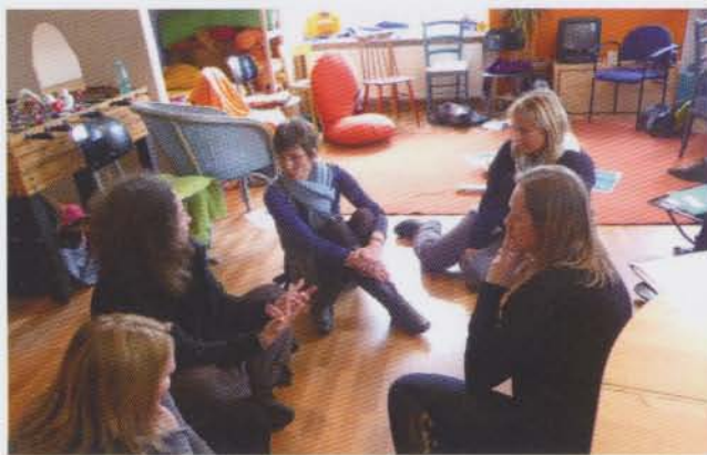
Mit Spaß neue Handwerkszeuge ausprobieren.

Famili en Team ist ein Trainingsangebot zur Stärkung der Erziehungskompetenz und der Erwachsenen-Kind-Beziehung auf den Grundlagen neuester wissenschaftlicher Forschungsergebnisse. Familiensystem- und Bindungstheorie sowie Erkenntnisse zur Emotionsregulation bilden den Hintergrund des Programms.